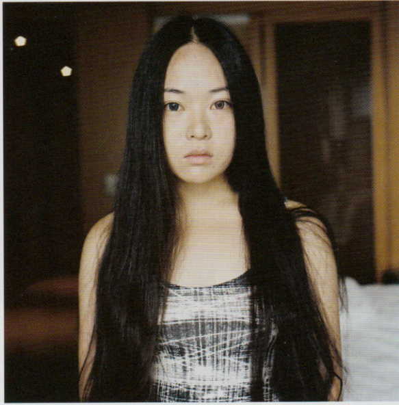
Uit de serie 'Portrait'.

ruim een miljoen inwoners. Veel Chinese Nederlanders komen er vandaan of, net als Xiao xiao, uit de dorpen eromheen. Xiao xiao probeerde meerdere opleidingen uit maar dat het met beeld te maken moest hebben was in ieder geval duidelijk. "De Fotoacademie was perfect voor mij, ik vond de Fotovakschool te technisch en de Kunstacademie te zweverig, dit was de juiste middenweg." Voor haar eindexamenproject keerde zij in 2009 terug naar haar geboorteland en studeerde vervolgens cum laude af met de serie 'Wenzhou'. En daar bleef het niet bij. Hetzelfde jaar won Xu de Fotoprijs en werd bij de Photo Academy Award in