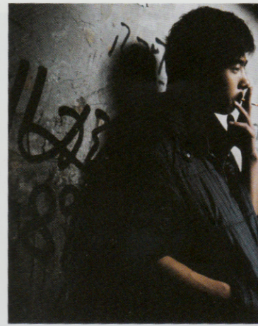
Uit de serie 'Wenzhou'.

Nederlandse fotografen de mogelijkheid terug te keren naar een eerder gefotografeerd onderwerp en dat verder uit te diepen of aan te scherpen. Xiao xiao Xu was al langer van plan om terug te keren: "De kans die ik nu krijg heeft mijn project