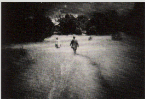
Uit de serie 'Recurring dreams'. Foto's Sabrina Scarpa.