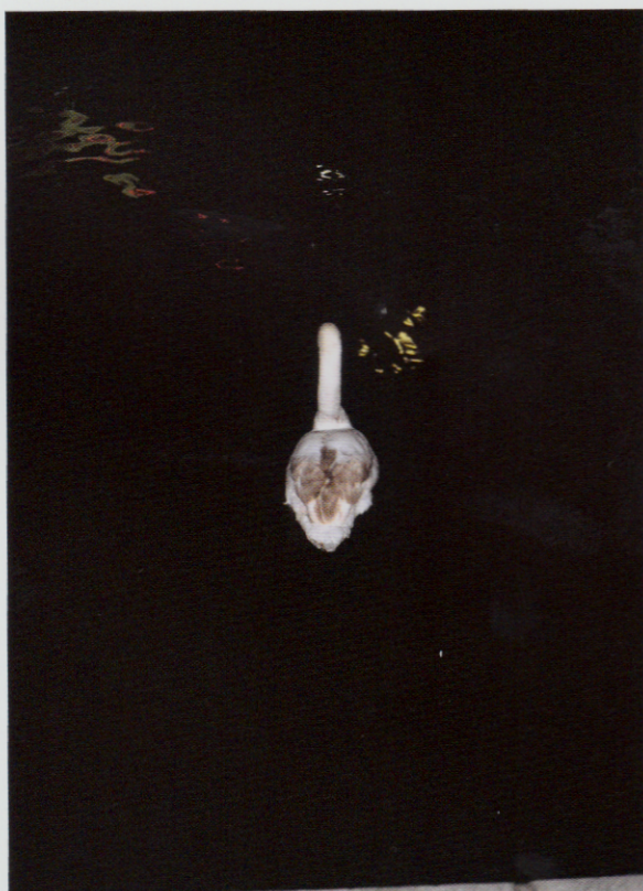
Zonder titel.