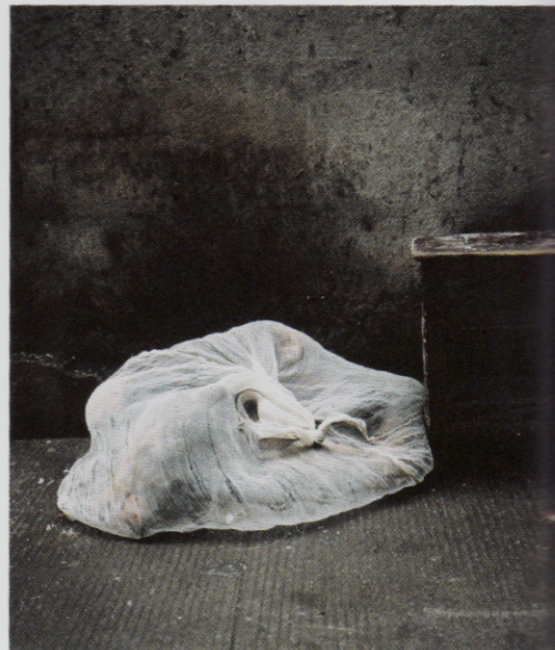
Uit de serie 'Love Doll Factory'.